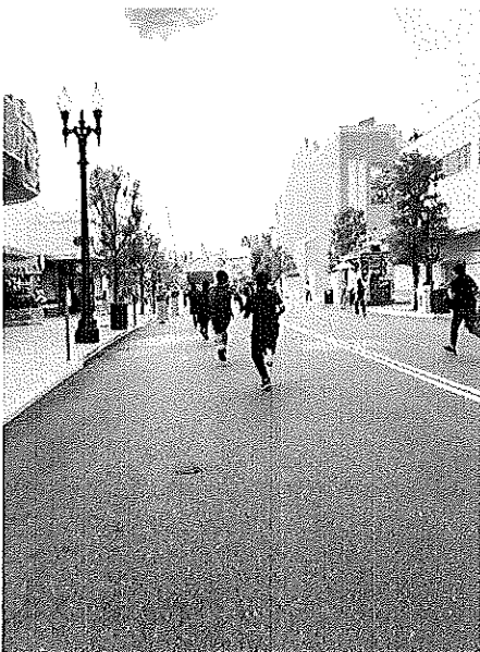
③ユニバーサルスタジオジャパンでの子どもたちの写真