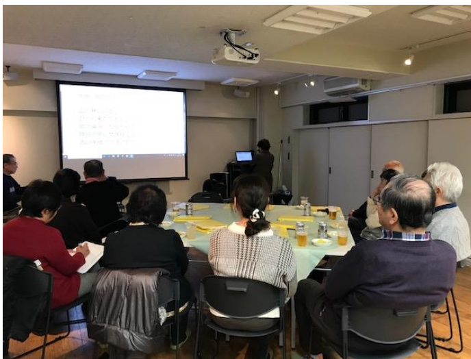
わが青春のコンサート