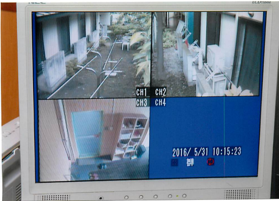
防犯カメラ設置工事前 旧映像画面