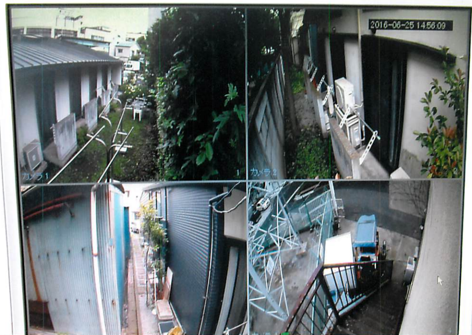
防犯カメラ設置工事後 新映像画面 (モニターは同一の物)