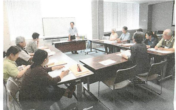
“任意後見制度の利用法を学ぶ”