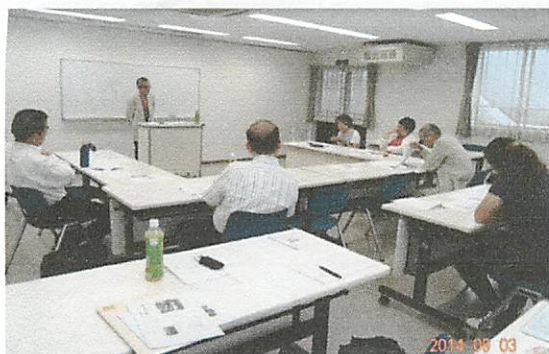
“マイノートの書き方講座”