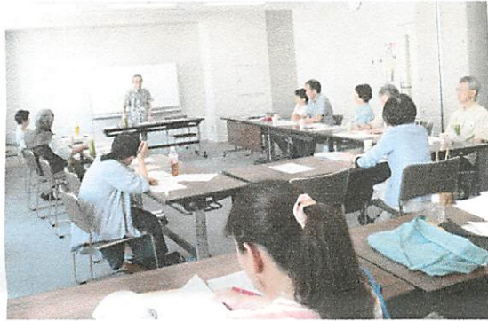
“マイノートの書き方講座”