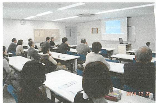
“成年後見制度講習会”