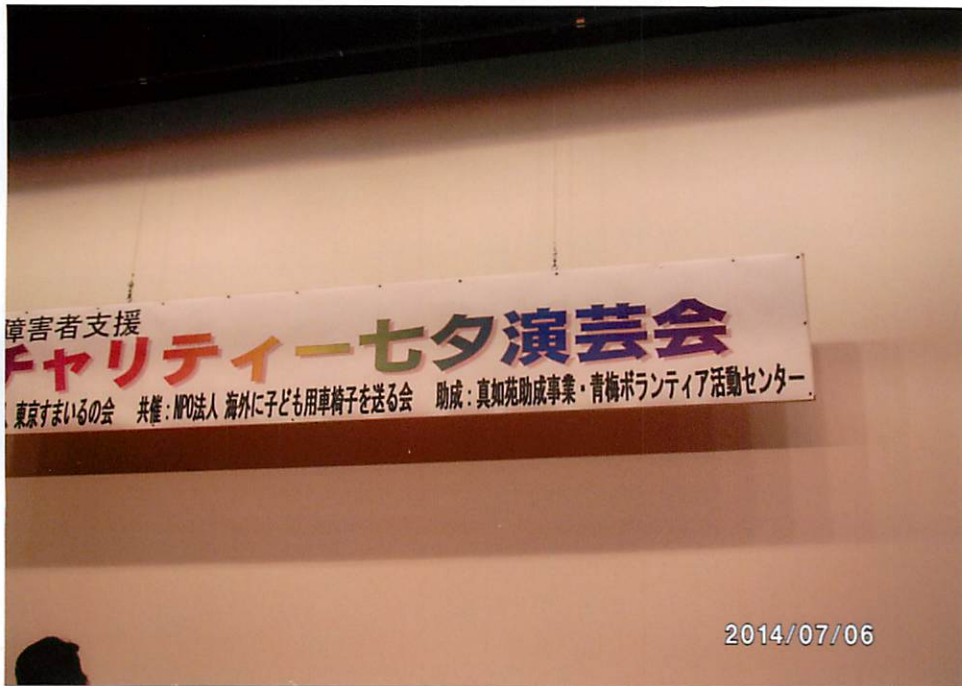
ステージ上の看板