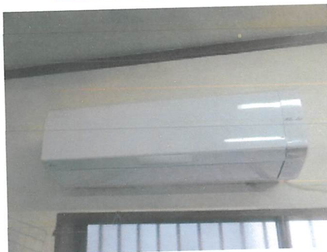
ケスジャン (1階カフェ天井)