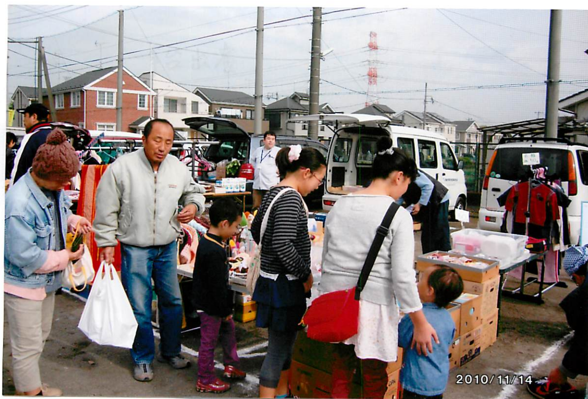
フリーマーケットのようす。