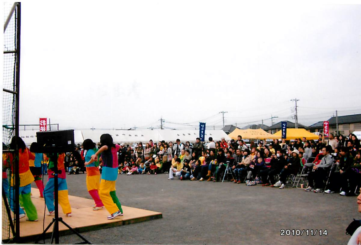
舞台出演者と観客